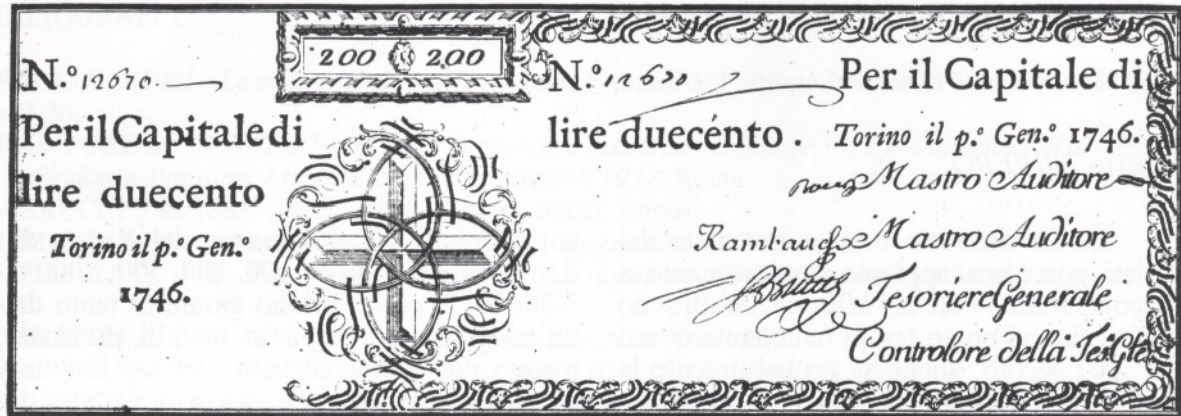
Figura I. Biglietto di credito di £. 200 emesso nel 1746 (Gabinetto Numismatico dei Civici Musei di Udine, collezione di Colloredo Mels).

stabilisce di introdurre in circolazione nel Regno di Sardegna le prime banconote della storia italiana. Tuttavia la storia della cartamoneta sabauda aveva avuto inizio quasi 35 anni prima, con l'arrivo di un banchiere inglese, John Law. Questi era figlio di uno stimato ed importante orefice di Edimburgo che, come era allora prassi, svolgeva anche una parallela attività bancaria. Nel 1694, anno di nascita della Banca d'Inghilterra, egli si trovava, appena ventitreenne, nella capitale britannica. Poi si trasferì in Olanda e quindi nella Francia di Luigi XV, stabilendosi a Parigi fin dal 1703. Nelle sue teorie sosteneva il vantaggio della creazione di una moneta cartacea, svincolata dal valore dell'oro e dell'argento, garantita, invece, dal valore della terra. Il banchiere scozzese riuscì, applicando teorie sostanzialmente corrette e rigorosamente razionali, a provocare uno dei maggiori dissesti finanziari che la storia riporti. Sebbene il teatro di tale dissesto sia stato la Francia del Duca d'Orleans, poco mancò che la prima applicazione delle